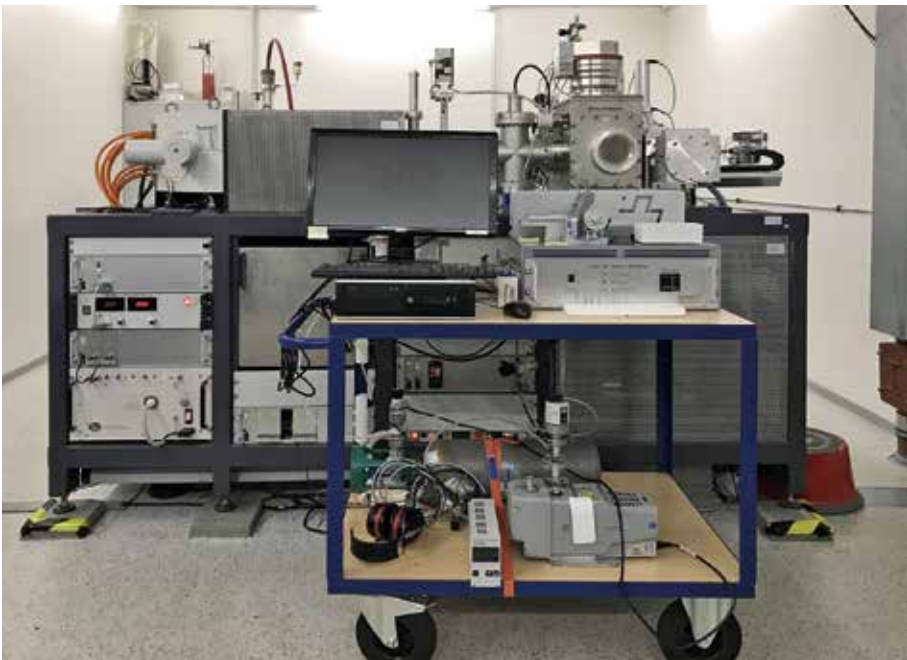
Im Klaus-Tschira-Labor für physikalische Altersbestimmung am CEZA in Mannheim befindet sich einer der modernsten Massenspektrometer (Typ MICADAS) zur ^{14}\text{C} -Datierung.

Am Curt-Engelhorn-Zentrum Archäometrie an den Reiss-Engelhorn-Museen befinden sich Labore mit modernsten Analysegeräten, um auch die Knochenarchive des Eiszeitalters zu untersuchen und hinsichtlich der Klima- und Umweltinformationen der jüngsten erdgeschichtlichen Vergangenheit zu entschlüsseln. Dazu gehören im Klaus-Tschira-Labor für physikalische Altersbestimmung neben dem Massenspektrometer für die Isotopenanalysen zur Ernährungsrekonstruktion, auch eines der modernsten Messgeräte zur Altersbestimmung mit der ^{14}\text{C} -Methode.