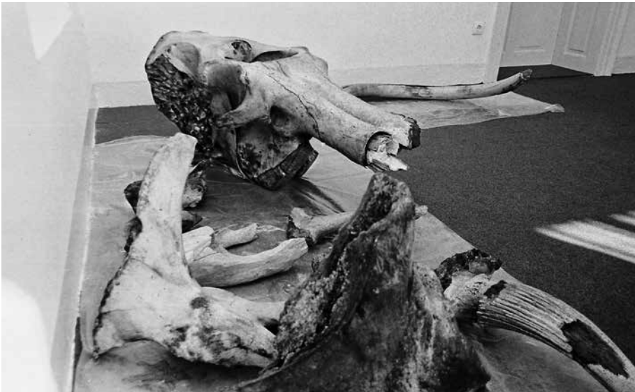
Im heutigen Kassenraum im Erdgeschoss sehen wir alle Funde aus dem Waidsee ausgebreitet.

Dankenswerterweise hat uns der Fotograf Fritz Kopetzky die Originalfotos seines Vaters Friedrich Kopetzky zur Verfügung gestellt.