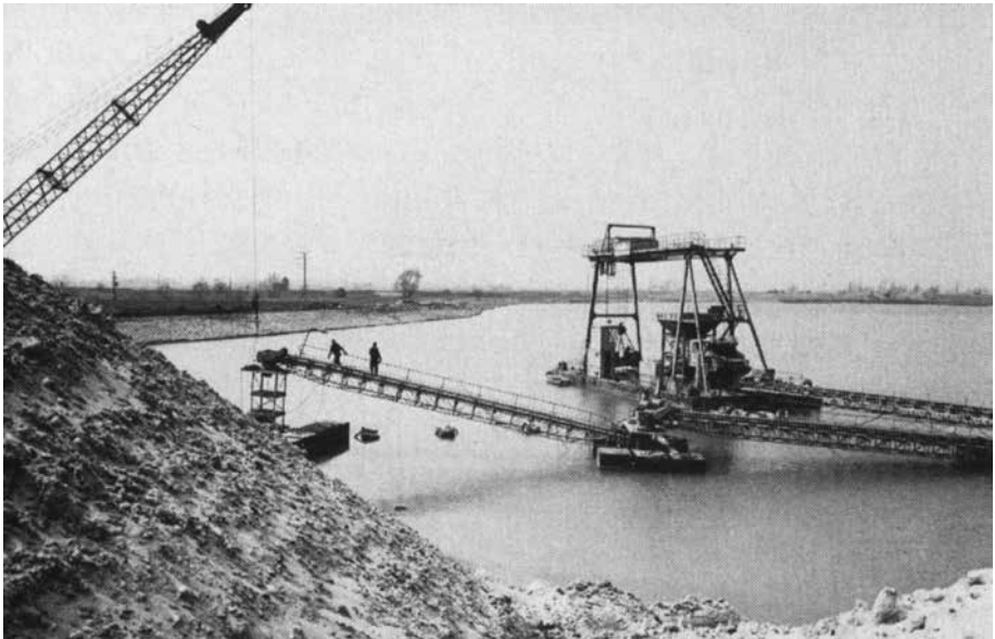
Baggerarbeiten auf dem Gelände des Waidsee, Ende der 1960er Jahre.