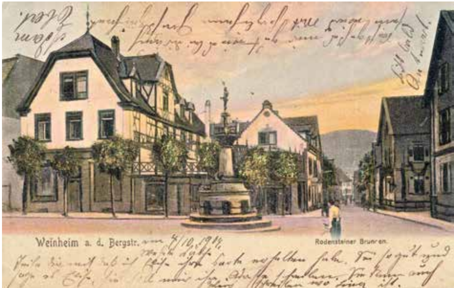
Ansichtskarte „Rodensteiner Brunnen“, gelaufen 1904.

Betrachtet man im Vergleich eine ebenfalls aus jener Zeit stammende Ansichtskarte, scheint es am Rodensteiner doch eher beschaulich zugegangen zu sein. Obwohl schon vor der Errichtung des Brunnens der Platz aufgrund seiner zentralen Lage eine „Drehscheibe Weinheims“ 5 war, sieht man auf diesem Bild lediglich einige Fußgänger. Ansichtskarten sind jedoch nicht notwendigerweise ein Spiegel der Realität, sondern vermitteln lediglich eine Sicht auf diese Realität. 6 Vielleicht wurde bewusst eine ruhige Stunde für die idyllische Aufnahme des Rodensteiners gewählt. Wie mag wohl das Verkehrsgeschehen in Weinheim um das Jahr 1905 tatsächlich gewesen sein?