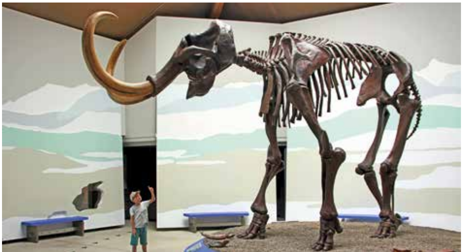
Das Skelett des Mammutbullen von Siegsdorf im Mammut- und Naturkunde Museum Siegsdorf bei Traunstein/Chiemgau ist mit deutlich über drei Meter Schulterhöhe eines der größten aus der letzten Kaltzeit.

Prof. Dr. Wilfried Rosendahl und Dr. Doris Döppes Reiss-Engelhorn-Museen, Zeughaus C5, 68159 Mannheim