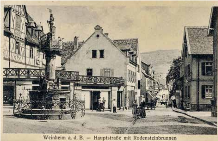
Ansichtskarte „Hauptstraße mit Rodensteinbrunnen“, gelaufen 1928, privat.

Trotz dieser Veränderungen unterschied sich der innerstädtische Verkehr um 1905 in seiner Art wohl kaum von jenem der vergangenen Jahrzehnte. Pferdefuhrwerke und Kutschen, Fußgänger und Reiter sowie Karren und Handwagen für den Transport von Gütern dürften das Bild der Stadt bestimmt haben. Hinzu kamen Radfahrer und Radfahrerinnen, die das moderne Verkehrsmittel ausgiebig nutzten. Immerhin bestanden zu dieser Zeit bereits drei Radfahrervereinigungen in Weinheim, gegründet 1891, 1898 und 1900. 11 Die beiden ersten Automobile kamen erst 1901 nach Weinheim und selbst 1926 waren nur 126 Fahrzeuge in Weinheim gemeldet. 12 Geteerte