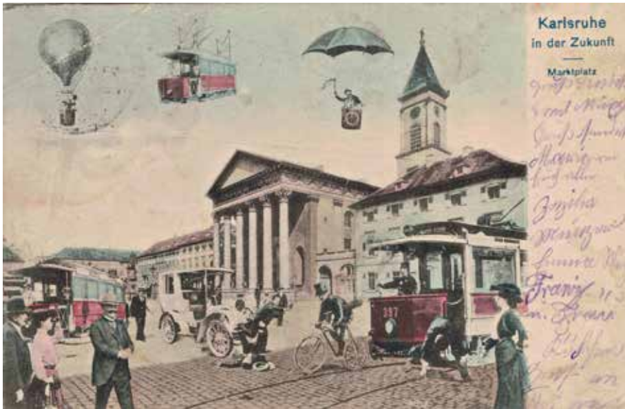
Ansichtskarte „Karlsruhe in der Zukunft“ gelaufen 1904, privat.

der jeweiligen Städte zusammen, von denen sie sich Stadtansichten schicken ließen. Die Originalbilder wurden um Staffagefiguren ergänzt, in der gewünschten Auflage gedruckt und zum Verkauf durch die lokalen Geschäftspartner an diese zurückgeschickt.“ 36 Ob man also lediglich häufig wiederkehrende und damit austauschbare Standardansichten von Städten wie Weinheim originell, provokant und damit verkaufsfördernd „aufwerten“ wollte, ist ebenso denkbar, 37 wie die Vermutung, solche Ansichtskarten seien Ausdruck von Zukunftsängsten oder gerade im Gegenteil von Technikbegeisterung.