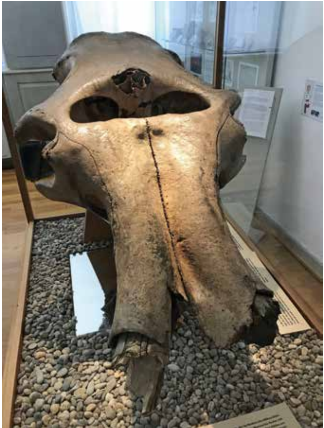
Der Mammutschädel aus dem Waidsee in frontaler Ansicht im Museum von Weinheim. Beide Stoßzähne sind kurz vor den Alveolen abgebrochen.

Über die Kies- und Sandgewinnung kamen über die Baggerschaufel auch immer wieder Skelettreste von eiszeitlichen Tieren an die Oberfläche. Diese Funde sind nicht nur Zeugen für das oben genannte Mammuttreiben in der Region während der letzten Eiszeit, sondern auch wichtige