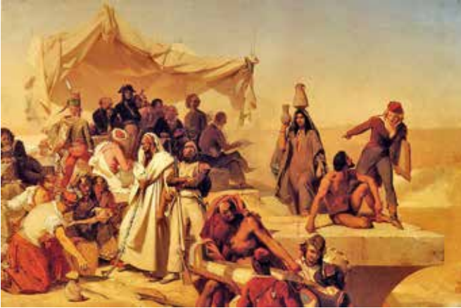
Abbildung 3: Léon Cogniet: Der Ägyptenfeldzug unter dem Oberbefehl von Bonaparte 1832 , Musée du Louvre Paris.

Armes einen prächtigen Kakadu, den sie konzentriert anschaut. Nicht die hübsche jugendliche Physiognomie der Frau hat der Künstler fasziniert dargestellt, sondern auch die Stofflichkeit ihrer Kleidung. Der grüne Rock, die weißen Rüschenärmel der Bluse und das rote, goldbestickte Mieder, bilden ein harmonisches, fein abgestimmtes Farbenspiel. Nichts wirkt überladen. Die